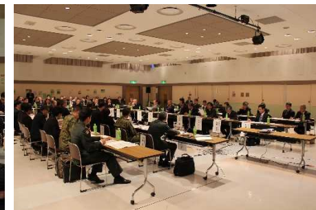
意見交換会参加者の様子②