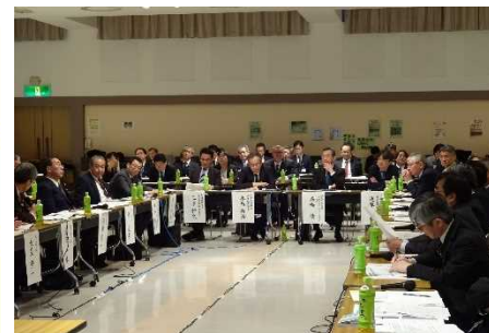
意見交換会参加者の様子①