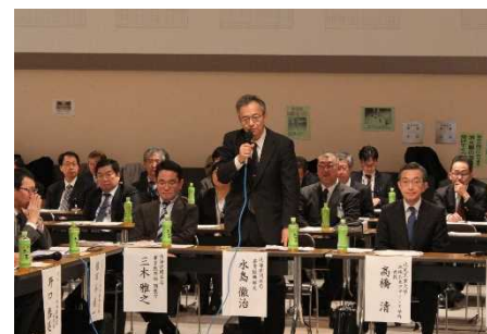
北海道開発局からの開会の挨拶