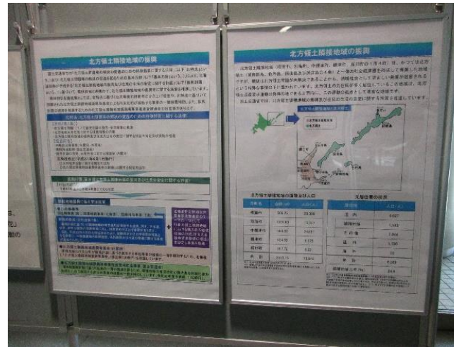
北海道開発局は北方領土隣接地域の振興等に関するパネルを掲示