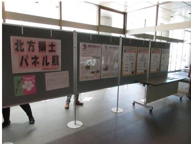
北方領土に関連するパネル(全22枚)