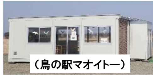
(鳥の駅マオイトー)