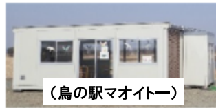
(鳥の駅マオイトー)