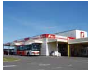
3) Bureaux de l'agence de location