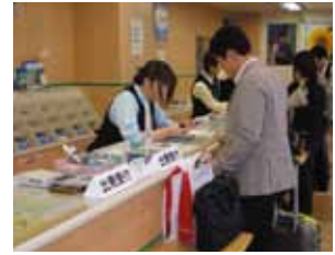
4) Comptoir de l'agence de location