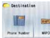
1) Appuyer sur « Phone number ».

Sélectionner la destination à partir d'un numéro de téléphone Saisir le numéro de téléphone du point d'intérêt où vous souhaitez vous rendre.