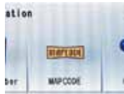
1) Appuyer sur le bouton « MAPCODE »

Saisir le numéro de 6 à 10 chiffres attribué à chaque point d'intérêt