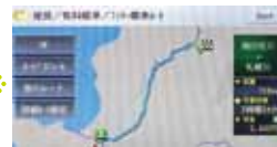
(3) Wählen Sie die gewünschte Route aus und das Navi beginnt Sie zu führen.