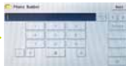
(2) Geben Sie die Telefonnummer ein. Vergessen Sie die Ortsvorwahl nicht.