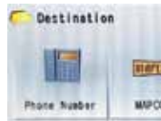
(1) Tippen Sie auf das Icon für die Telefonnummer

Eingabe über die [Telefonnummer] Die Auswahl des Zielorts kann über die Eingabe der Telefonnummer erfolgen.