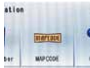
(1) Tippen Sie auf das Icon „MAPCODE“

Eingabe per [MAPCODE] Jeder erfasste Ort hat einen „MAPCODE“, der aus 6-10 Ziffern besteht.