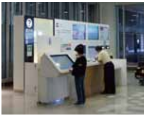
(1) Mietwagen-Stand (am Flughafen New Chitose)