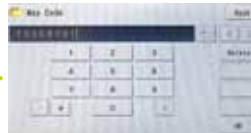
(2) Geben Sie die entsprechenden Code-Ziffern ein.