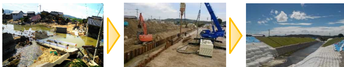
<末政川復旧工事の様子>

甚大な被害が生じた真備地区の土地約 1,600 筆の土地について、登記官が 700 人を超える登記名義人の法定相続人の探索を実施しました。法定相続人情報の活用により所有者探索が大幅に省力化されました。