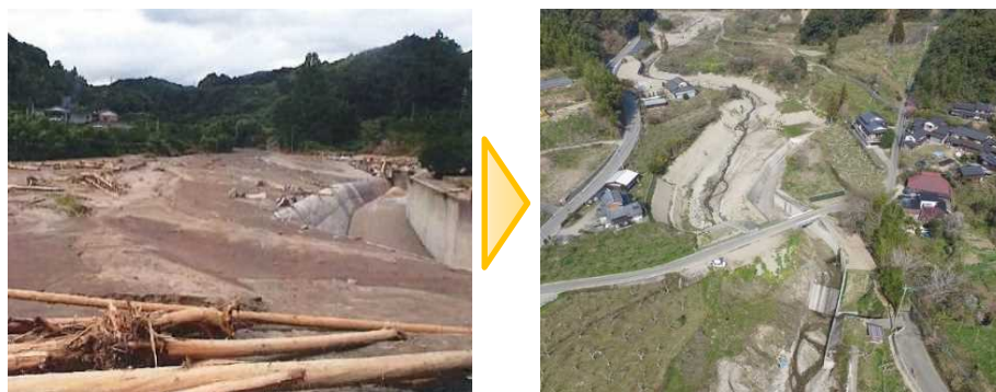
<被災地域（志波地区）の復旧の様子>

記録的豪雨の影響により市内各地で災害が発生し、速やかに復旧工事を進めるため、朝倉市からの求めに応じ、朝倉市の土地約 2,000 筆の土地について、登記官が 800 人を超える登記名義人の法定相続人の探索を実施しました。法定相続人情報の活用により所有者探索が大幅に省力化されました。