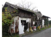
建築物のイメージ