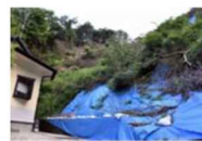
豪雨の度に土砂崩れが多発