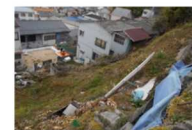
高台から瓦礫や岩石、柵等が落下するおそれ