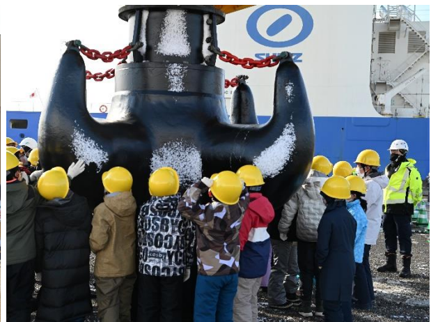
メインフック見学の様子