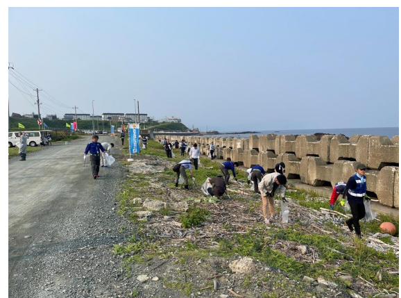
みなとオアシスるもい運営協議会の活動 （Port Clean in 留萌（清掃事業））