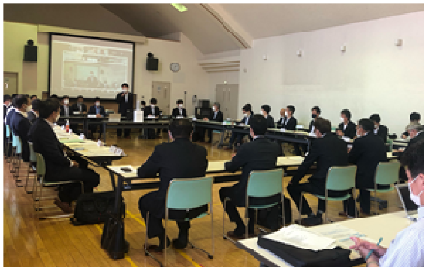
第1回室蘭港カーボンニュートラルポート協議会開催の様子

事務局である室蘭市港湾部は、「室蘭港におけるポテンシャルが高い水素や洋上風力の拠点港化と、各立地企業のカーボンニュートラル達成について、最終的な到達点とそこに至る道筋が見えるような計画を官民連携で作っていききたい。」と話し、閉会いたしました。