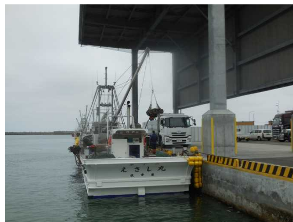
屋根付き岸壁 水揚げ状況 （枝幸町水産商工課）