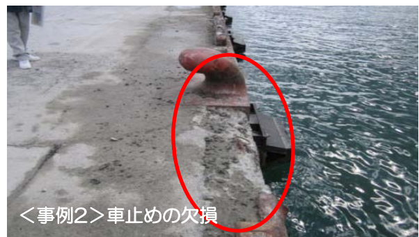
<事例2> 車止めの欠損