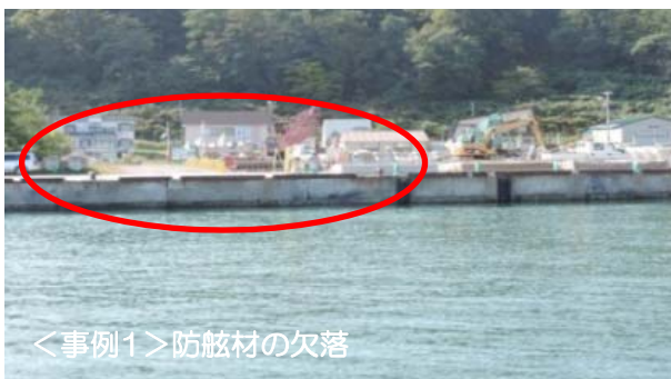
<事例1> 防舷材の欠落

なお、今年度の実地監査は7月中旬以降、順次行う予定ですが、実施日等の詳細については関係する港湾管理者様と調整の上、お知らせします。