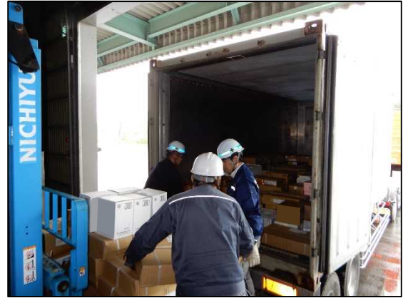
小口混載コンテナのバンニングの様子

今後は荷主や商社といったサービス利用者に向けた広報活動を行い、各事業者の体制が整い次第、月1回以上の頻度で定期的な輸送を行います。