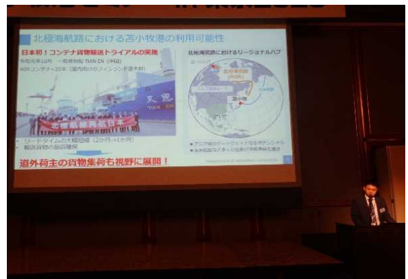
＜苫小牧港概要説明＞