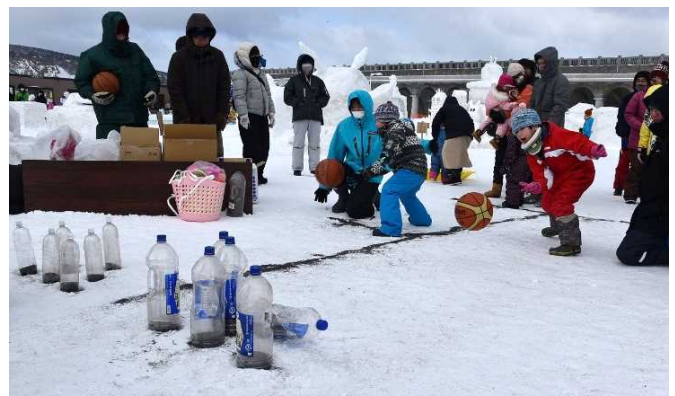
稚内のみなとを考える女性ネットワーク 主催のイベントの様子