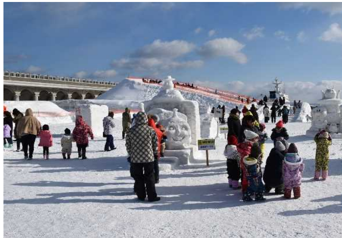
イベント会場の様子

また、2月9日(日)には、「稚内のみなとを考える女性ネットワーク」主催の「かまくらで遊ぼう」も同じ広場で行われ、ペットボトルをピンに見立てたボーリングを開催し、倒すピンの数により笑顔と歓声に沸いていました。