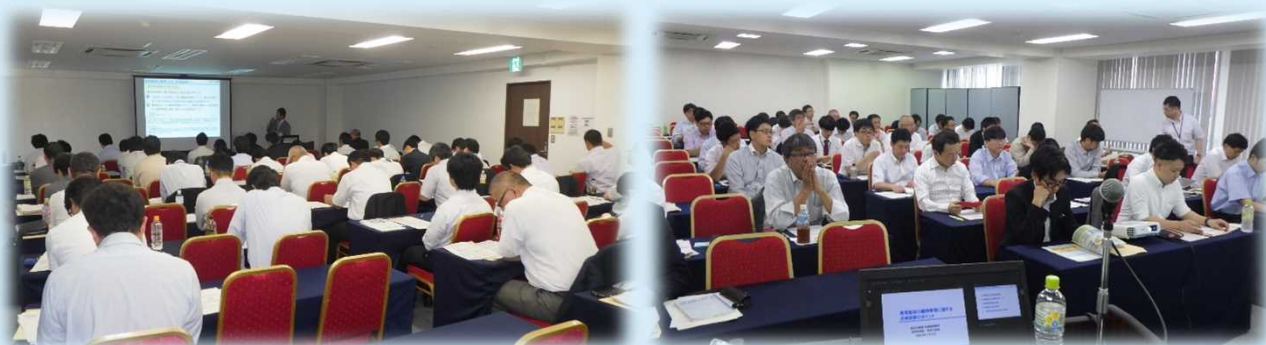
昨年度講習会の様子