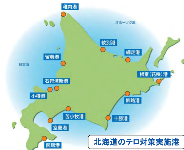
北海道のテロ対策実施港

2001年9月に発生した米国同時多発テロ事件を契機に世界中のみなとで保安対策強化が義務付けられました(改正SOLAS条約)。 日本のみなとでも2004年から保安対策が実施されており、北海道では12のみなとでテロ対策を実施しています。