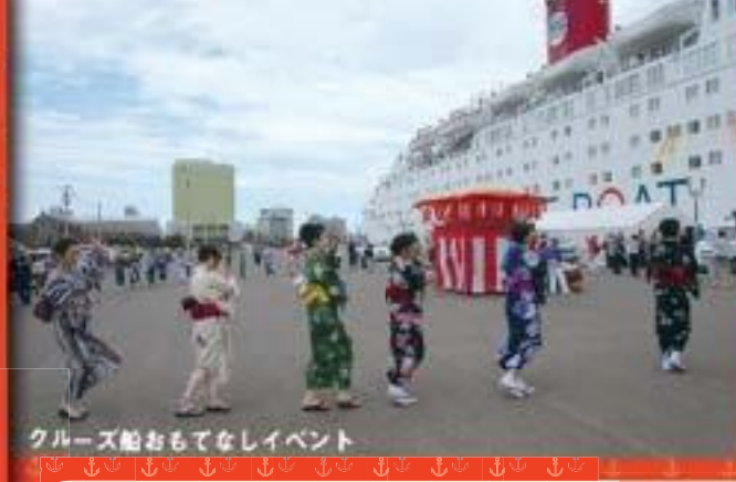
クルーズ船おもてなしイベント