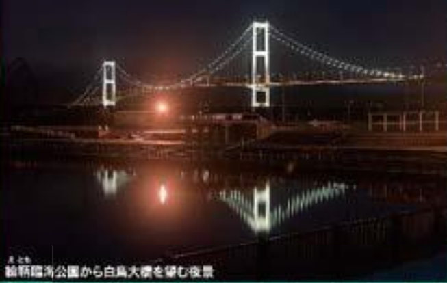
室蘭臨海公園から白鳥大橋を望む夜景