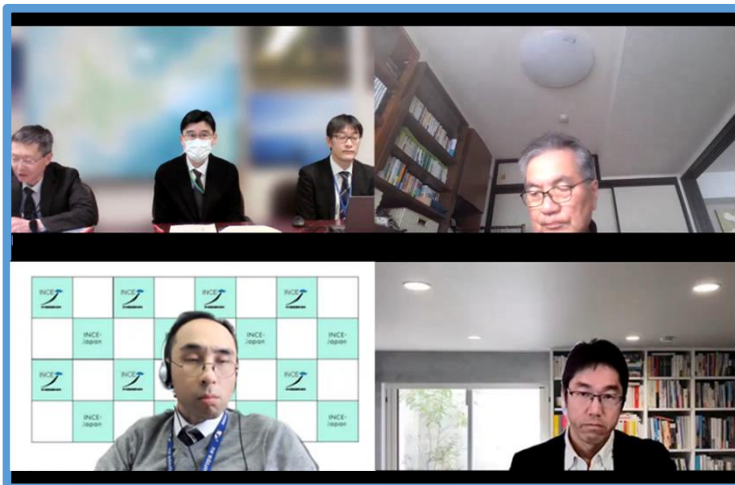
▲第2回評価委員会（Web開催）

今後、いただいたご意見に対するPI推進協議会の回答を付した上で本年度末を目途に最終とりまとめとして公表させていただきます。ご協力ありがとうございました。