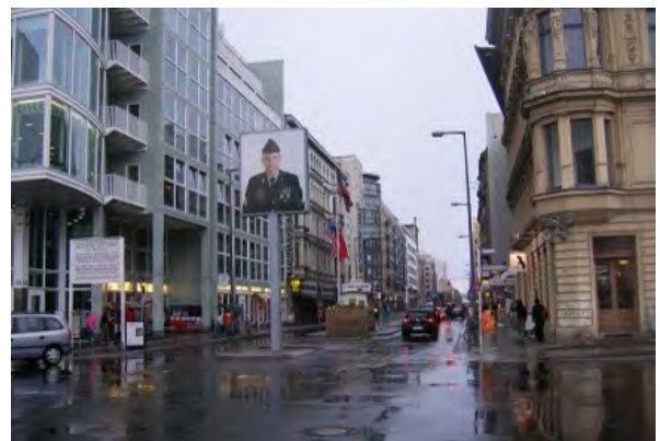
▲ベルリンの街並み (ドイツ)