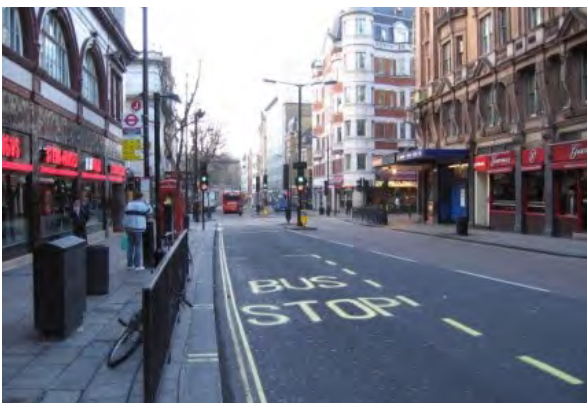
▲パリの街並み (フランス)