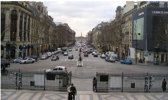
▲ロンドンの街並み (イギリス)