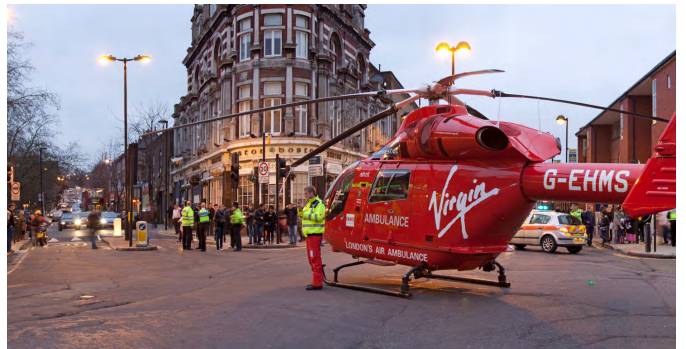
▲ドクターヘリが着陸するロンドンの交差点