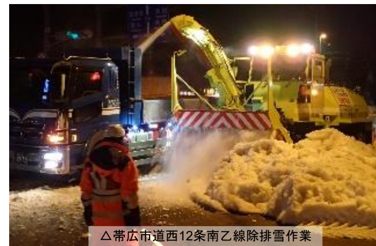
△帯広市道西12条南乙線除排雪作業