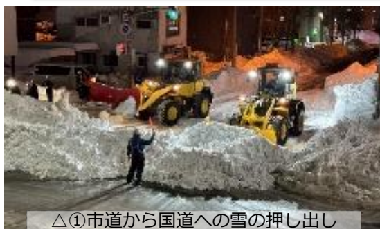
△①市道から国道への雪の押し出し