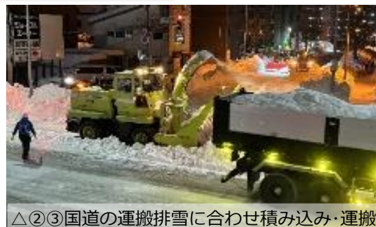
△②③国道の運搬排雪に合わせ積み込み・運搬