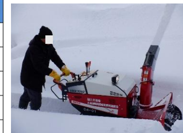
小型除雪機の活用状況（留萌市）