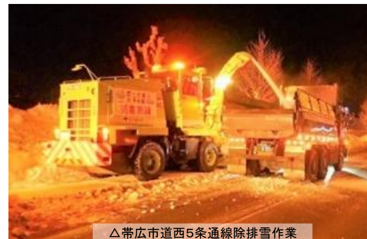
△帯広市道西5条通線除排雪作業