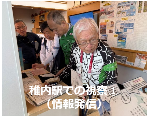
稚内駅での視察① (情報発信)