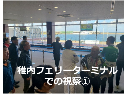
稚内フェリーターミナル での視察①