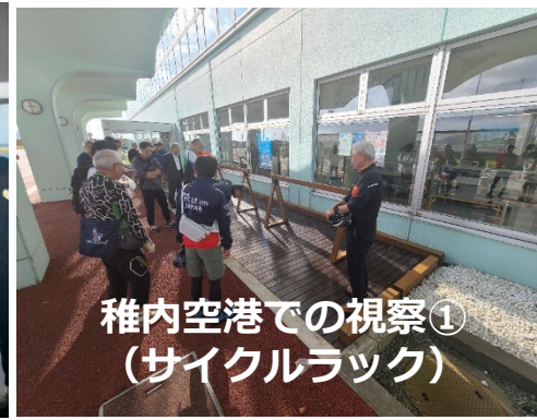
稚内空港での視察① (サイクルラック)