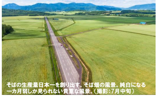
●景観資源・B そばの花ビューポイント「白銀の丘」