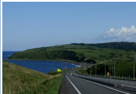
●景観資源 サハリンの島影