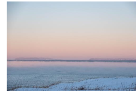
※道北ルート連携フォトコンテスト2018 萌える天北オロロンルート ルート賞 作品名: 北へ進路を取れ