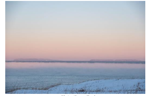
※道北ルート連携フォトコンテスト2018 萌える天北オロロンルート ルート賞 作品名: 北へ進路を取れ