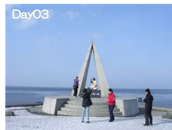
宗谷岬：日本最北の地へドライブ