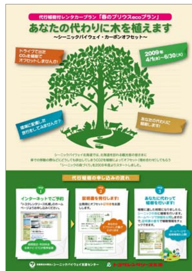
トヨタレンタリース札幌との連携 (ワンコインオフセット)