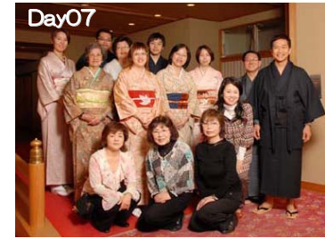
松前矢野旅館：着付け体験