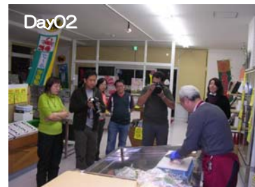
稚内うろこ亭：たら解体&鍋体験