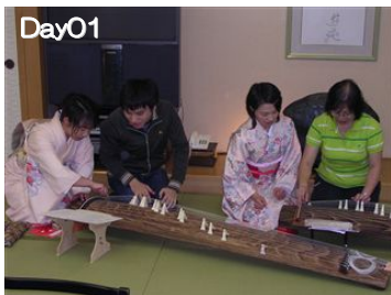
留萌：お琴体験（宿 光風館）