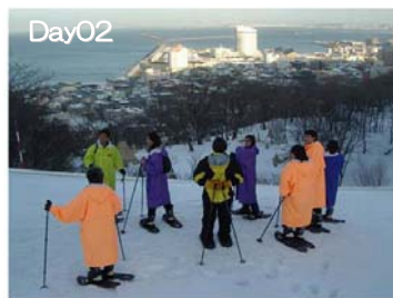
稚内公園：スノーシュー体験