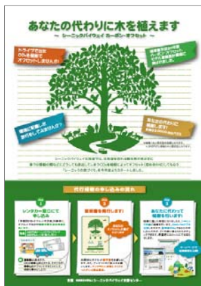
ニッポンレンタカー北海道との連携 (2009.1からの継続)