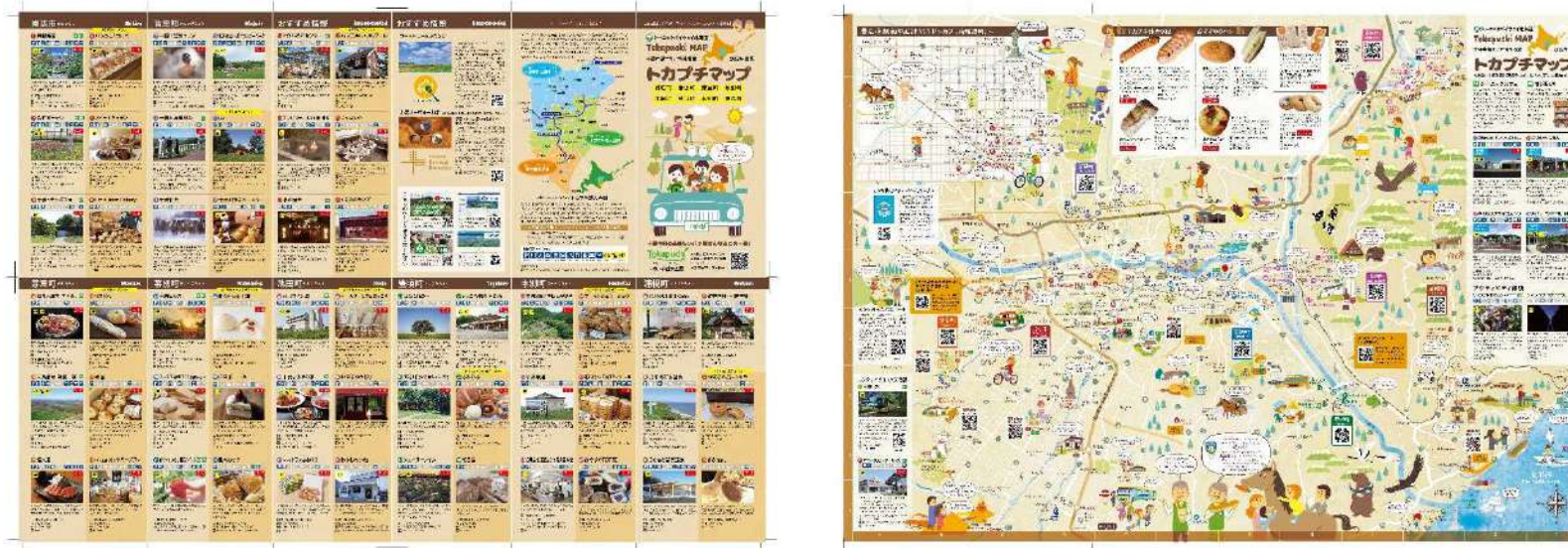
<トカプチ雄大空間ルートMAP（トカプチマップ）>