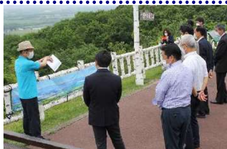
静岡県と北海道十勝・帯広の交流・連携事業 （十勝が丘展望台視察対応）

LIFE+CONCIERGE 十勝の魅力・生活の楽しみ方を伝える人 ご当地風土アドバイザー