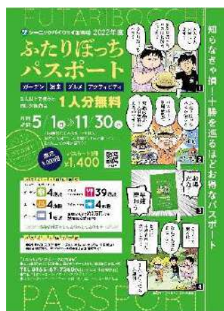
ふたりぼっちパスポート (チラシ表面)