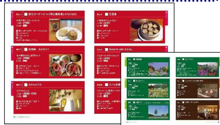
ふたりぼっちパスポート(中面)