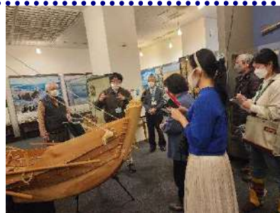
ライフコンシェルジュの会の様子