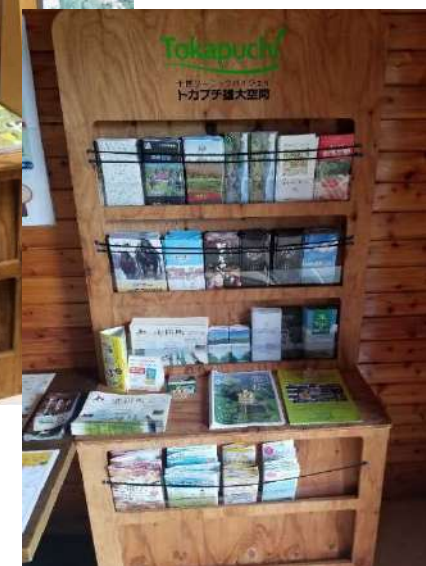
<トカプチ情報ボックス/JR帯広駅 とかち観光情報センター・十勝まきばの家>