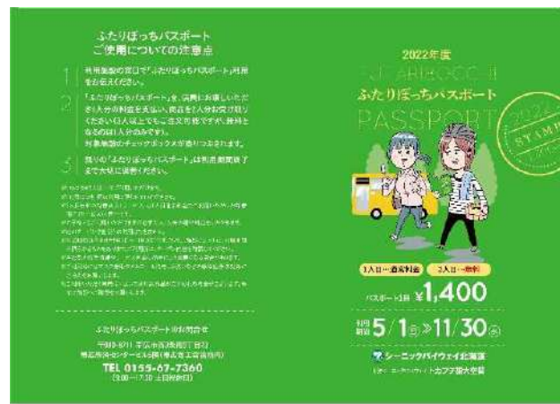
ふたりぼっちパスポート(表面)