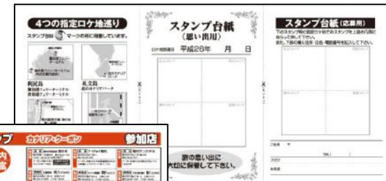
ロケ地を巡るスタンプラリー台紙