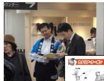
首都圏住民（横浜）でのアンケート調査