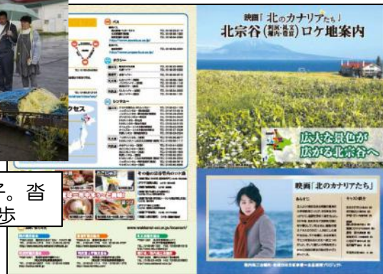
作成した北宗谷ロケ地案内パンフレット