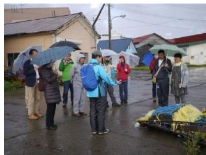
モニターツアーの様子。沓形の早朝街歩き散歩