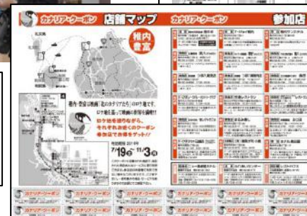
地域飲食店等で利用できるクーポン