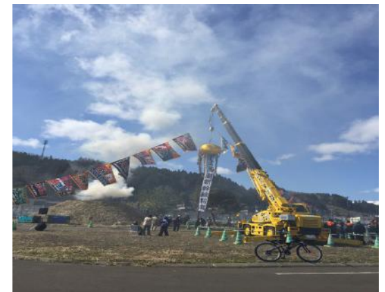
のろし上げセレモニー 青森日本風景街道連携