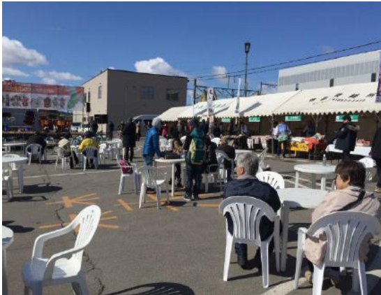
食と文化のフェスティバル 9町連携