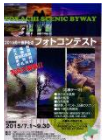
フォトコンテスト募集チラシ