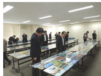
フォトコンテスト審査会