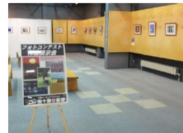
フォトコンテスト巡回作品展