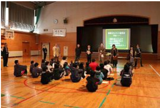
学校シーニックバイウェイの授業の様子