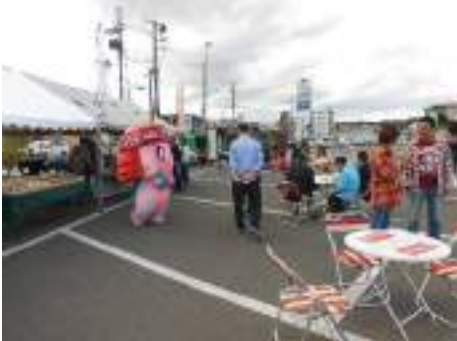
左より網走、清里、ウトロ

【参加団体】網走市観光協会、小清水町観光協会、東藻琴観光協会、清里町商工会、きよさと観光協会、上斜里フラワーロード推進協議会、清里町花と緑と交流のまちづくり委員会、知床斜里町観光協会