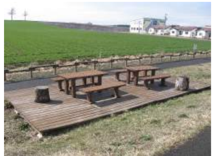
老朽化により現在修理中のメルヘンの丘シーニックデッキ