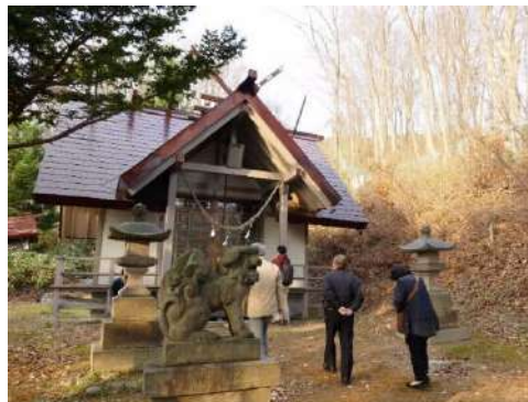
札幌軟石をふんだんに活用した白川神社