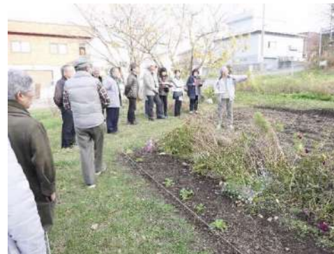
簾舞空地利用の事例紹介