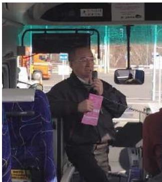
福士会長のガイドの様子