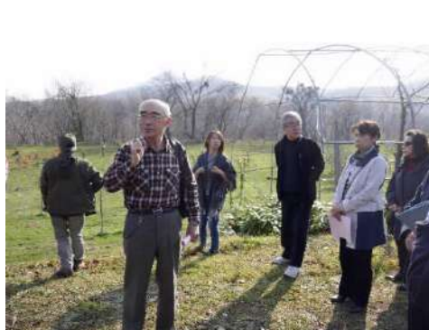
近隣農家と協力して地域を盛り上げようと活動している砒山ふれあい果樹園