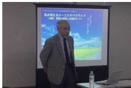
「シーニックバイウェイって結局のところ何？～今更だけど聞いてみよう～」の様子