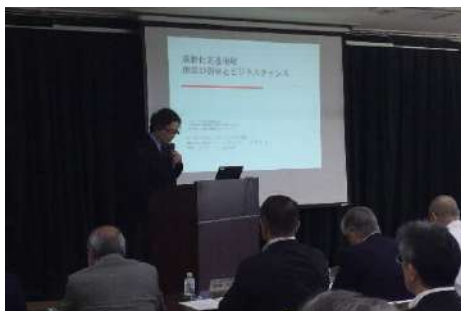
人口問題シンポジウムの様子