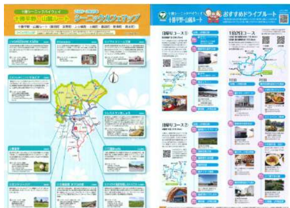
(裏) 十勝平野・山麓ルート シーニックカフェマップ おすすめドライブルート