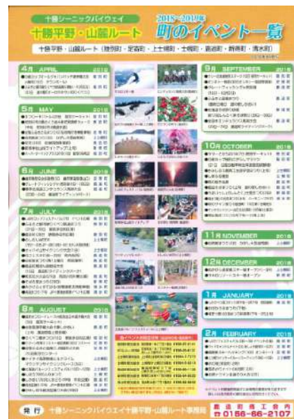
(表) 町のイベント一覧