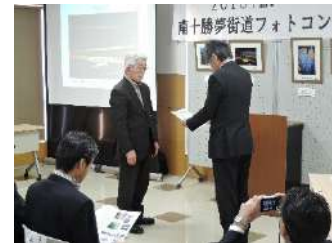
フォトコンテスト表彰式