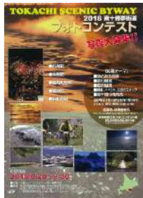
フォトコンテスト募集チラシ

【参加人数】 フォトコン応募者数：66名 応募作品数：225点 カレンダー：1,500部作成