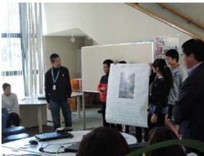
学校シーニックバイウェイの授業の様子