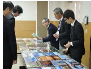
フォトコンテスト審査会