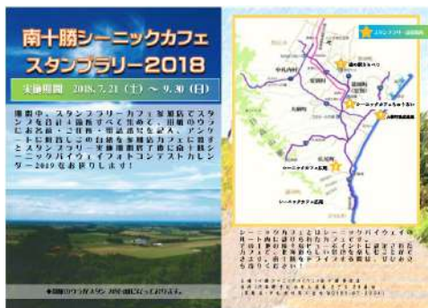
スタンプラリー用紙（表面）

【応募人数】完全性覇者：10名（十勝管内：6名、十勝管外：3名、北海道外：1名）