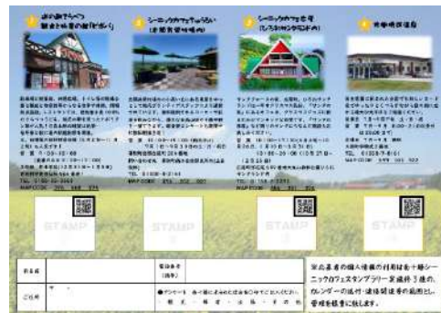
スタンプラリー用紙（裏面）