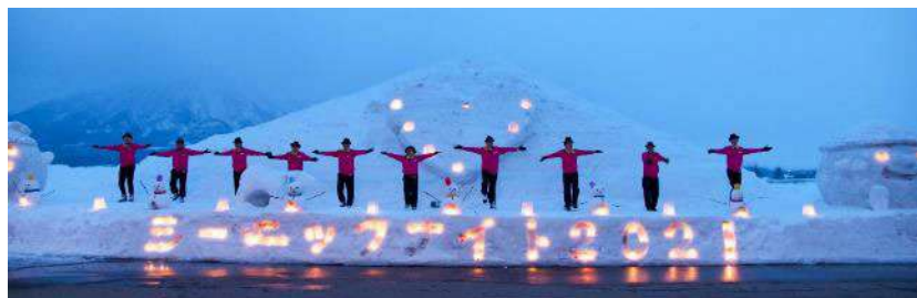
倶知安おやじダンサーズ