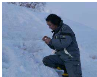
スノーキャンドルの点灯