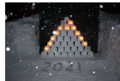
後志総合振興局前