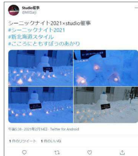
室蘭工業大学Studio催事の投稿