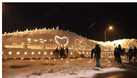
峠下チェーン着脱場