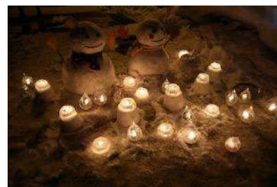
倶知安開発事務所前