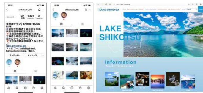
▲Instagram「SHIKOTSUKO LIFE」、支笏湖ポータルサイト「LAKE SHIKOTSU」を開設。NEWSピックアップやアクティビティカレンダーにて、季節毎の体験コンテンツを発信