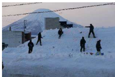
スノーキャンドルの制作