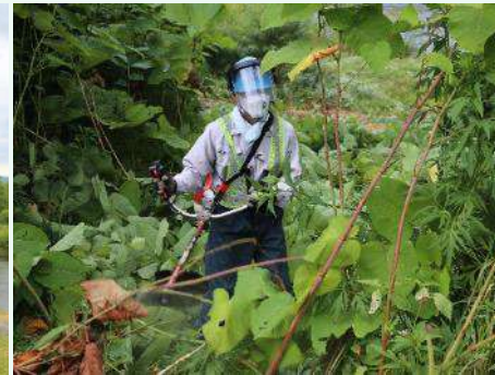
▲マスクを着用して作業実施