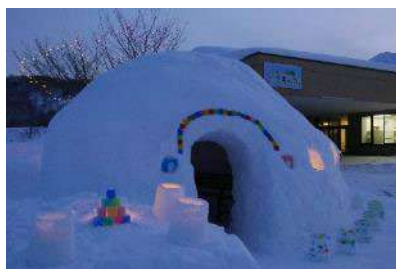
愛和の里きもべつ