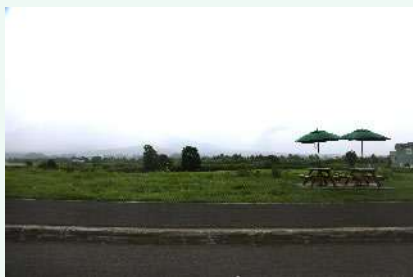
《倶知安町 八幡地区》