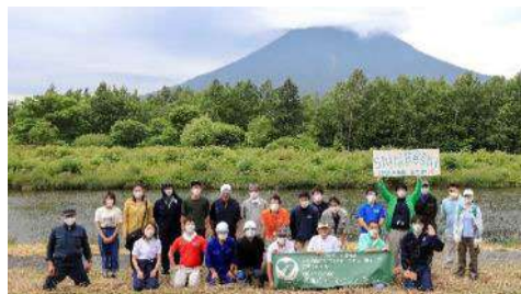
京極町 更進地区にて