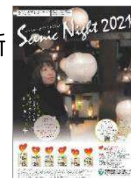
シーニックナイト2021のポスター▶