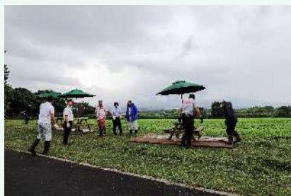
《喜茂別町 相川地区》