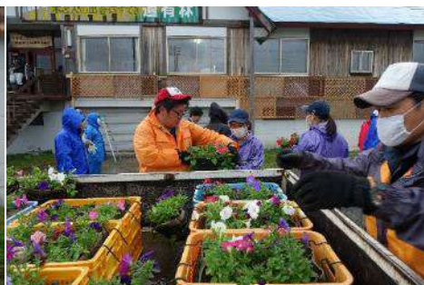
高校生によって育てられた花々