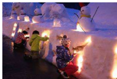
八幡ビューポイントパーキング