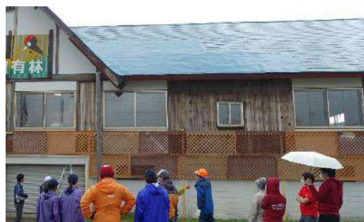
フラワーハンギング設置前