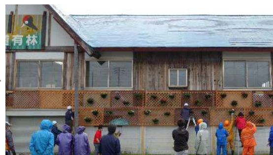
フラワーハンギング設置後