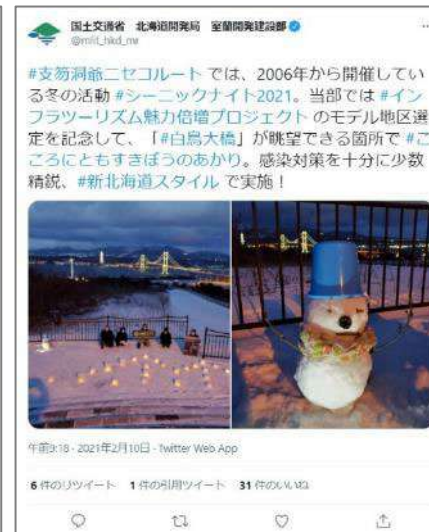
室蘭開発建設部の投稿