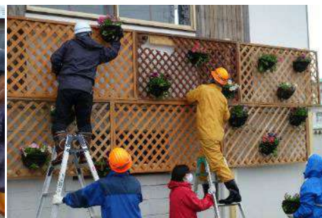
壁面へのフラワーハンギング設置