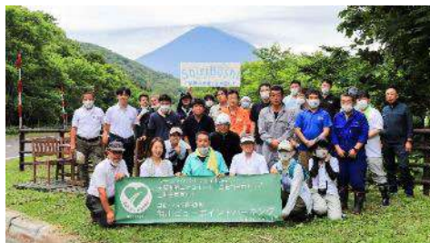
喜茂別町 相川地区にて