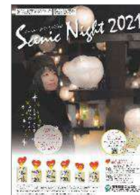
シーニックナイト2021のポスター▶