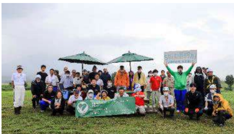
倶知安町 八幡地区にて