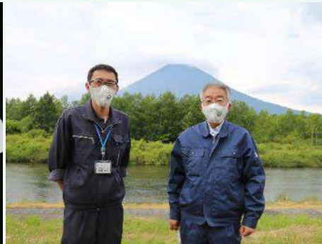
▲京極町梅田町長(右)