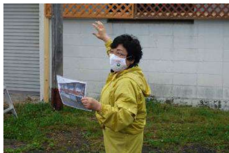
小野氏による事前説明