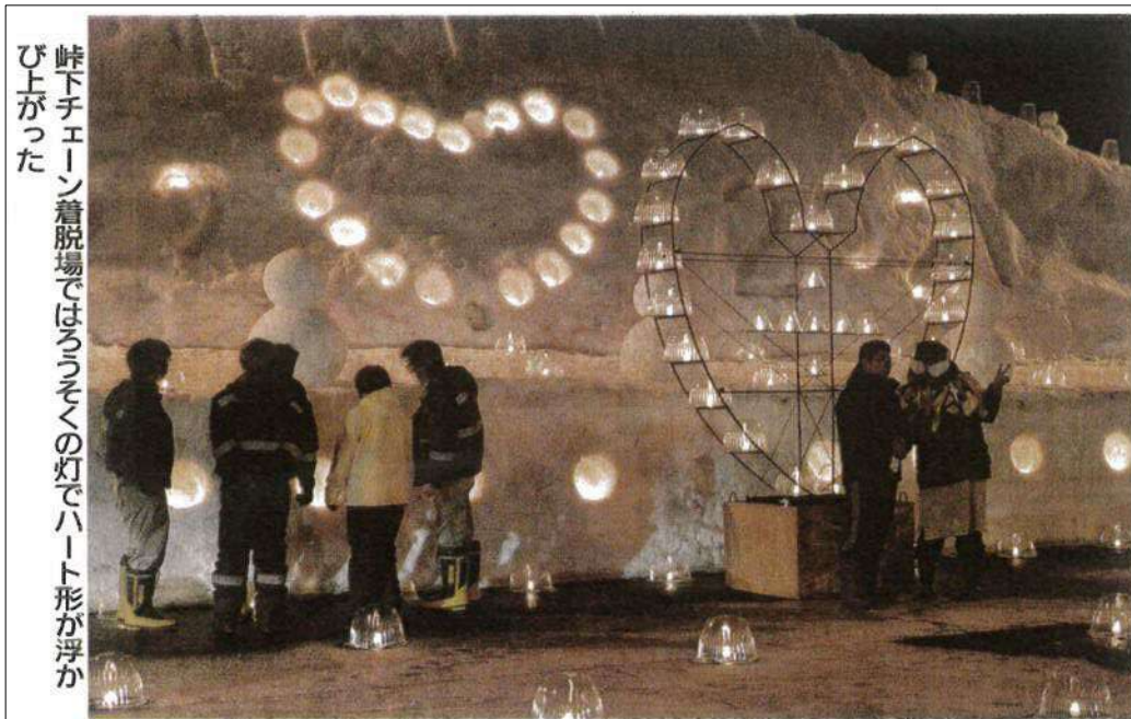
峠下チェーン着脱場ではろうそくの灯でハート形が浮かび上がった