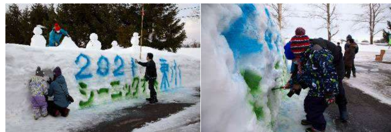
倶知安町立東小学校