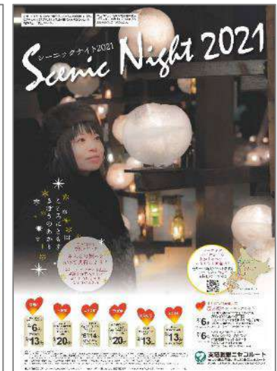
シーニックナイト2021 ポスター