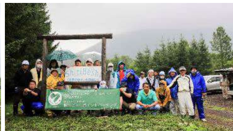
ニセコ町 みらいの森にて