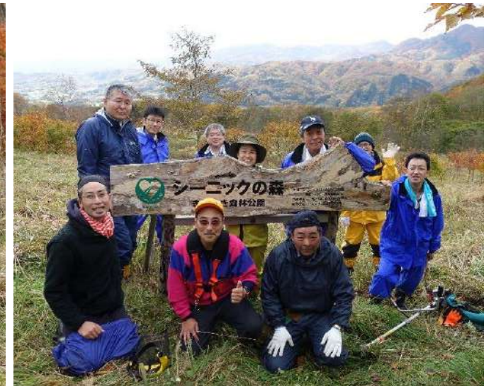
▲参加者全員での集合写真