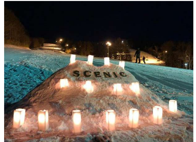
▲函館七飯スノーパーク（七飯町）