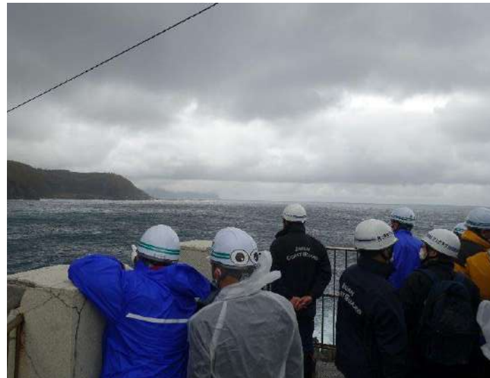
▲日浦岬灯台の視察