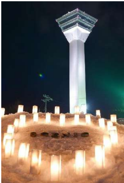
▲五稜郭公園（函館市）