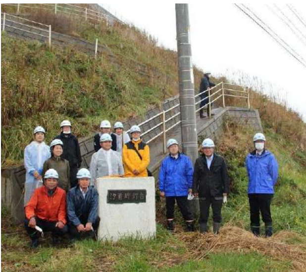
▲汐首岬灯台の視察