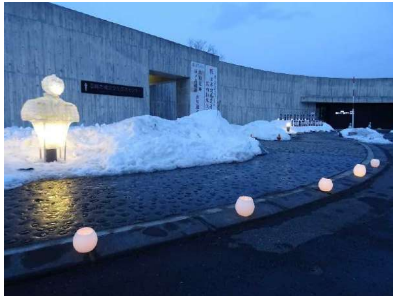
▲函館市縄文文化交流センター（函館市）