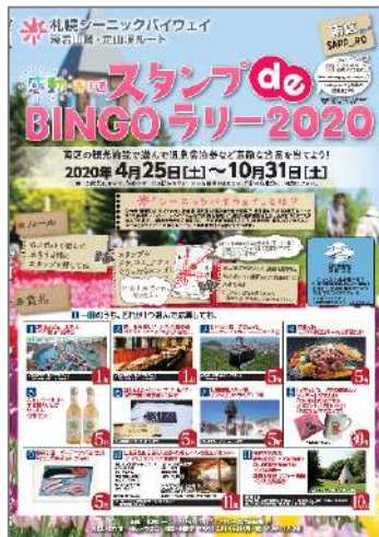
スタンプラリーチラシ