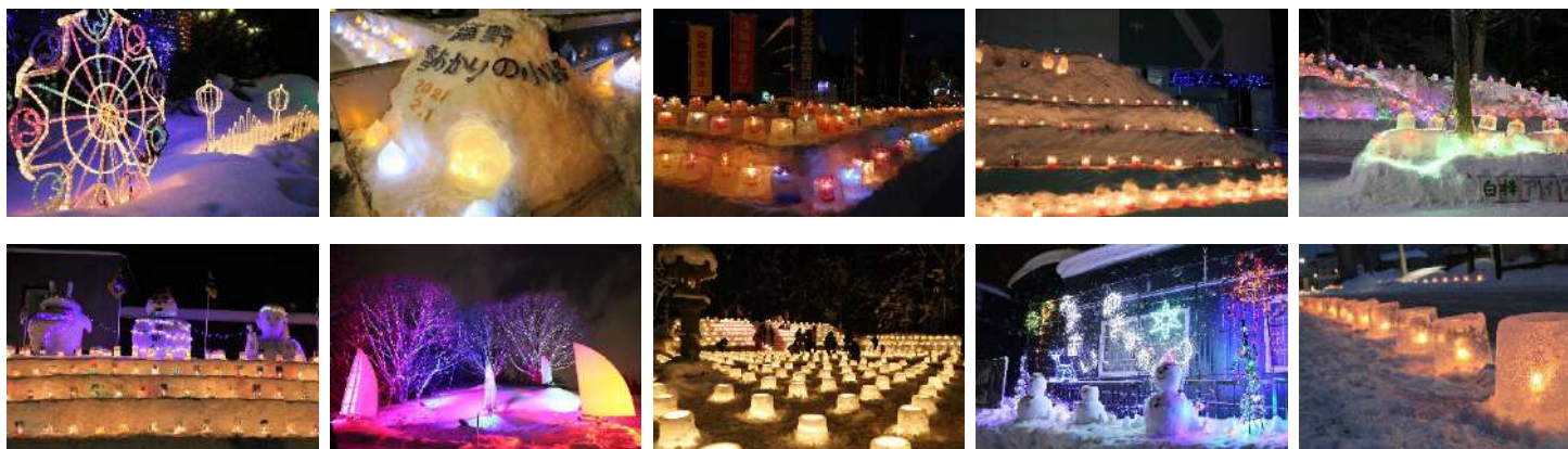
各地区での雪あかりの様子