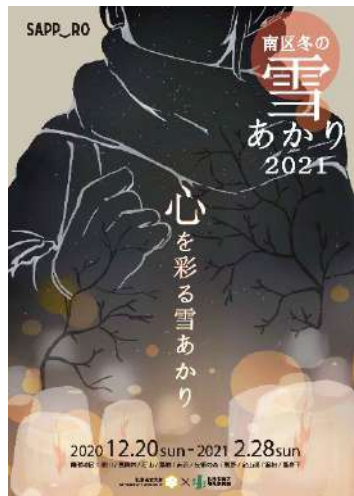
雪あかりチラシ（表面）

【協力】 札幌市南区、札幌市立大学、札幌シーニックバイウェイ藻岩山麓・定山溪ルート