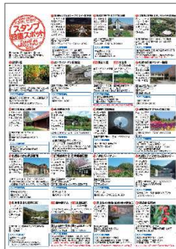
スタンプ設置スポット