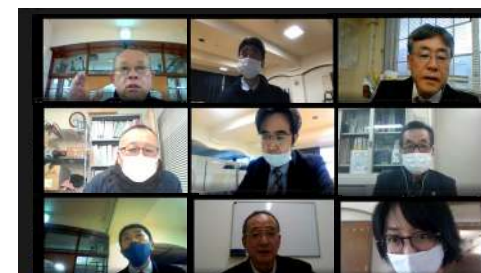
秀逸な道勉強会の様子