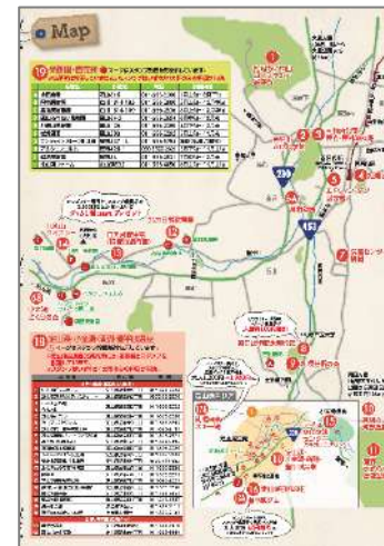
スタンプラリーマップ