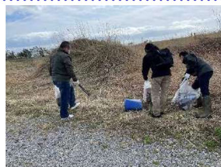
木古内町 サラキ岬