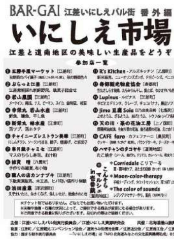
江差いにしえ市場（開催中止）