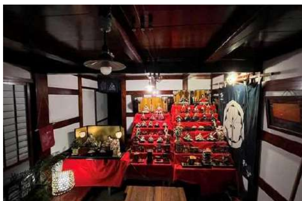
江差北前のひな語り