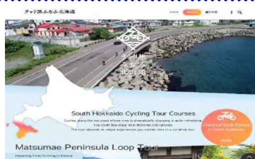
チャリ旅みなみ北海道 HP英語版・FB