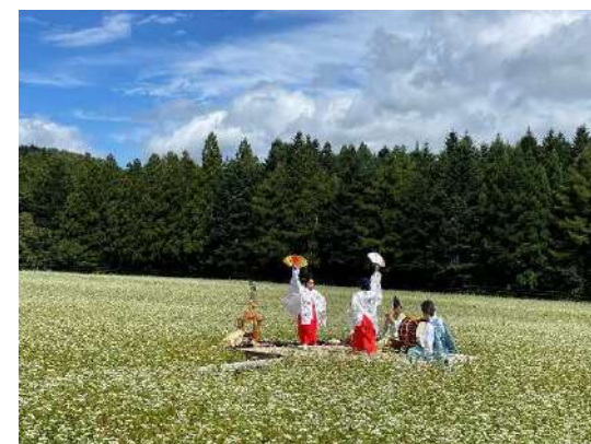
千軒そば花観賞会