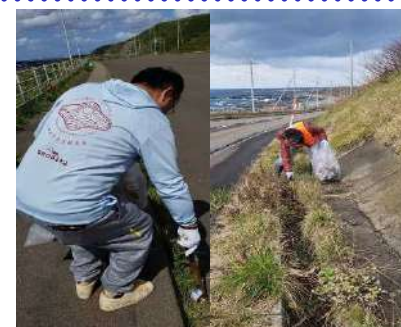
松前町 秀逸な道候補区間