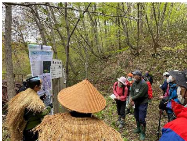
殿様街道探訪ウォーク活動（春）

【主催】 福島町千軒地域活性化実行委員会・福島町観光協会・福島町教育委員会・福島町