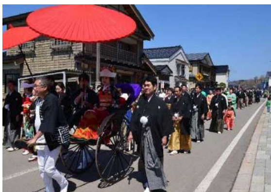
江差いにしえ街道花嫁行列