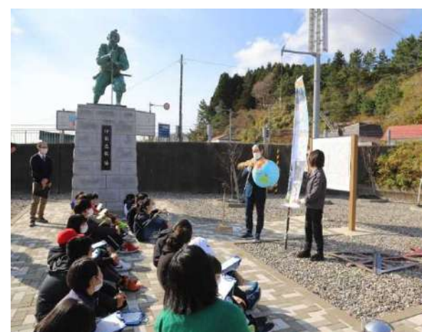
歴史勉強会 随時開催