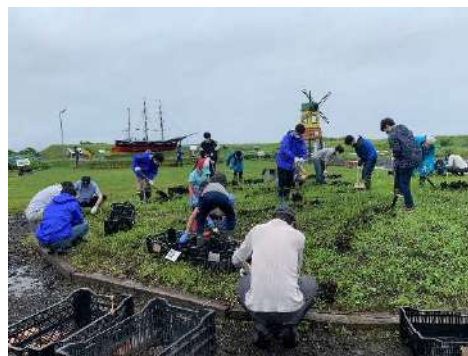
球根掘起し作業 7月