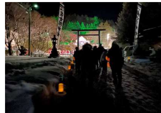
木古内町みそぎキャンドル