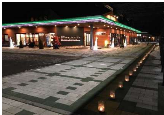
道の駅連携シーニックdeナイト （木古内町）