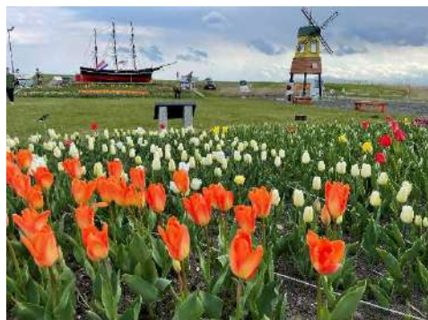
チューリップフェア5月