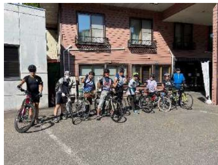
サイクルツアー実施