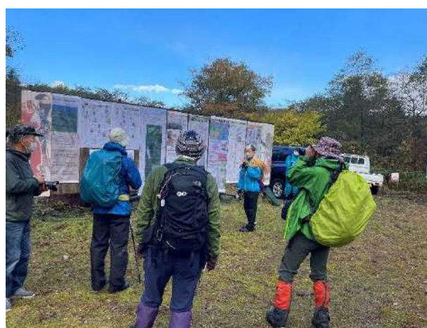
殿様街道探訪ウォーク活動（秋）