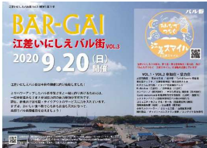
江差いにしえバル街（開催中止）