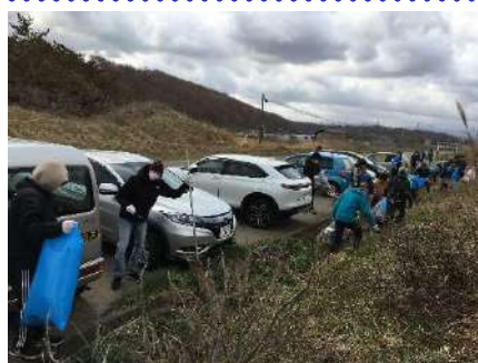
江差町 椴川駐車場