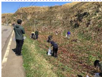
松前町 白神展望広場駐車場

【参加人数】 ≪松前（2022年30名・2021年50名・2019年30名）・江差（2022年35名・2021年20名・2019年30名） 木古内（2022年50名・2019年100名）≫ 松前町秀逸な道候補区間＝実施4名参加