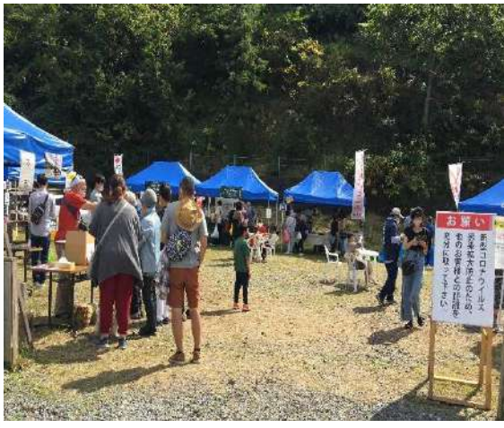
江差いにしえ市場2020年の様子