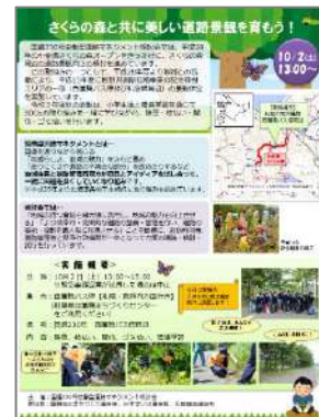
活動参加募集チラシ