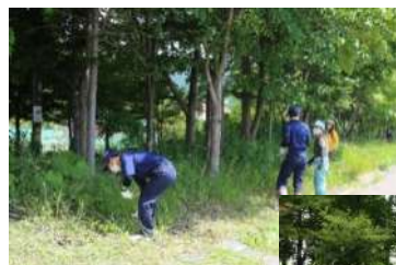
初夏に実施した 草刈りの様子 （6月）