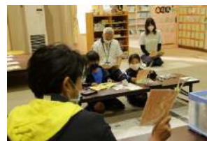
道について学ぶ児童