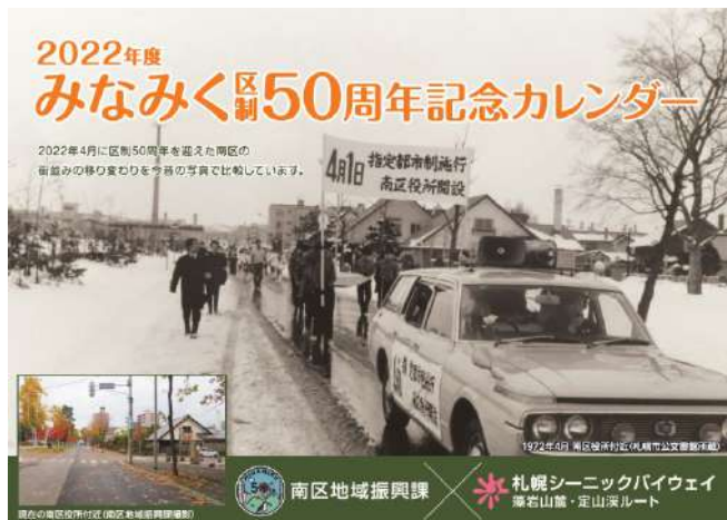
カレンダーの表紙