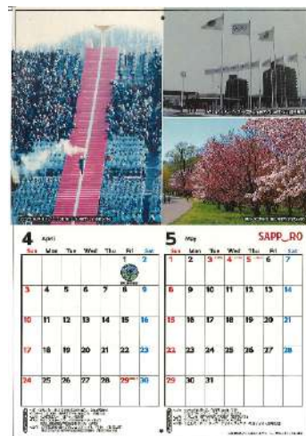
カレンダーの内容