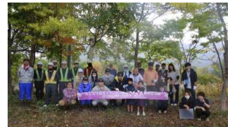
参加者全員の集合写真（10月）