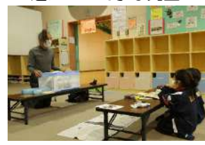
環境について学ぶ児童