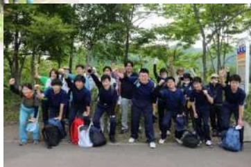
春の活動に参加してくれたみなみの杜 高等支援学校の生徒達（6月）