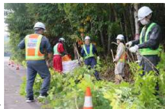
樹木を間伐する様子（10月）