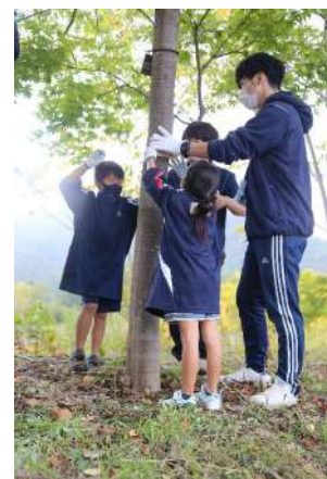
児童らによる樹名板の設置