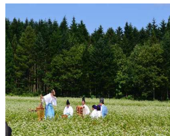
千軒そば花観賞会