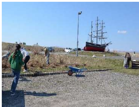
木古内サラキ岬 中止

【参加人数】令和2年度開催中止 《木古内(2019年100名・2018年90名・2017年40名)・松前(2019年30名・2018年11名・2017年開催なし)・江差(2019年30名・2018年30名・2017年30名)》 松前町実施4名参加