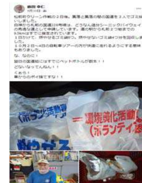
松前町秀逸な道区間実施