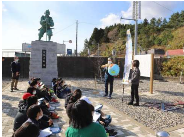
殿様街道歴史勉強会