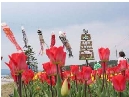
チューリップフェア5月

《球根掘起し(2019年70名・2018年70名・2017年50名)・球根植え(2019年100名 2018年110名・2017年100名) ・福島町植栽(2019年25名)》