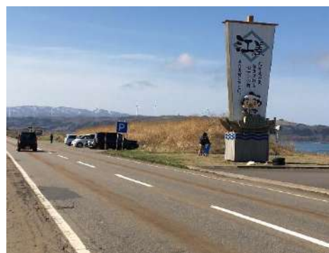
江差榎川 駐車帯 中止