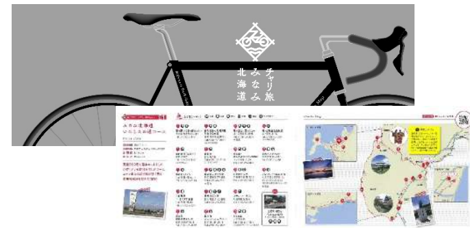
サイクリングコースマップ