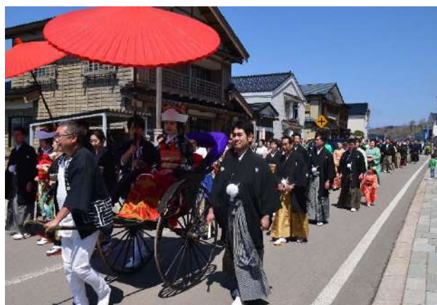
江差いにしえ街道花嫁行列