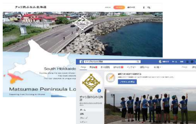
チャリ旅みなみ北海道 HP英語版・FB