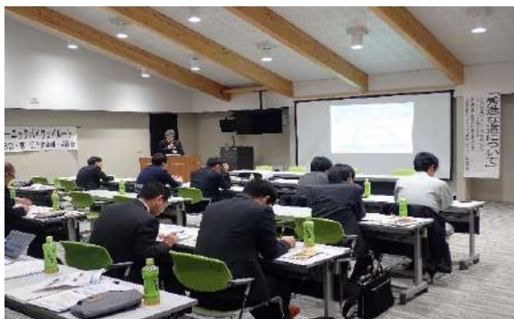
秀逸な道学習会（令和元年度）

【日時】令和2年11月30日（月） 【会議形式】メール配信 （メーリングリストによるメール配信での全体会議だったことから学習会開催中止）