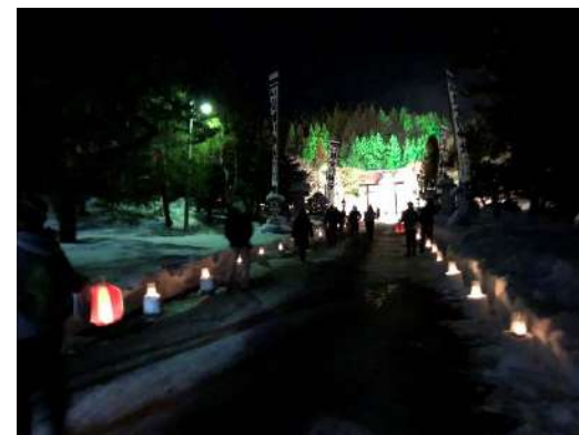
木古内みそぎキャンドル