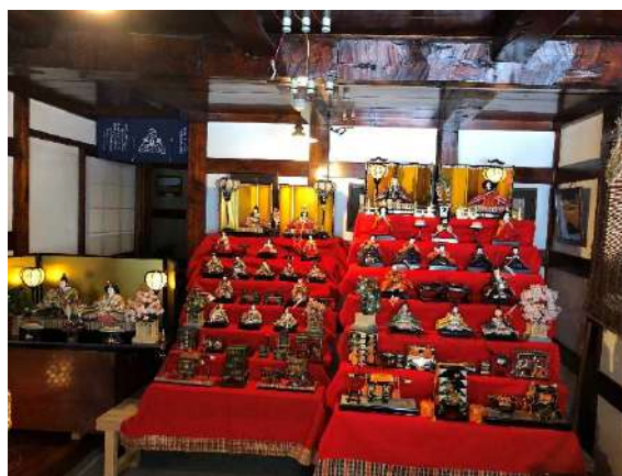
江差北前のひな語り