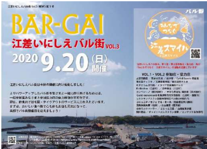
江差いにしえバル街（開催中止）