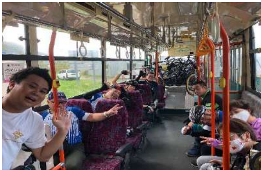
サイクリングツアー開催