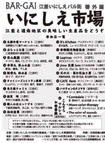
江差いにしえ市場（開催）