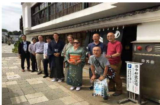
インバウンド報告と対応（予定項目）