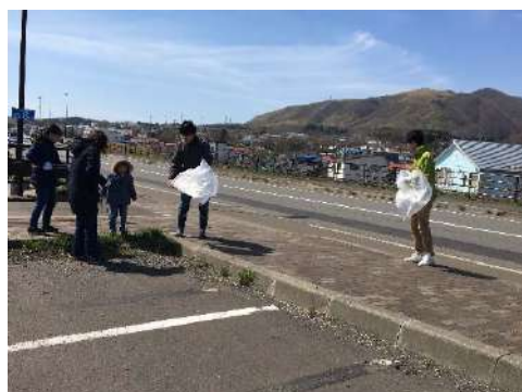
松前 道の駅周辺 中止