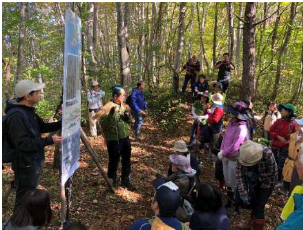
殿様街道探訪ウォーク活動

【主催】 福島町千軒地域活性化実行委員会・福島町観光協会・福島町教育委員会・福島町