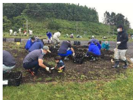
球根掘起し作業 7月