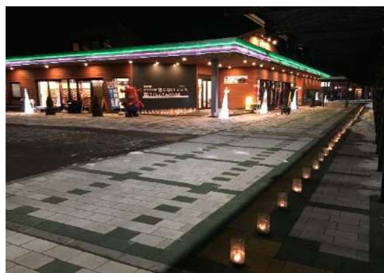
道の駅連携シーニックdeナイト （木古内町）