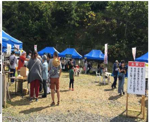
江差いにしえ市場開催当日