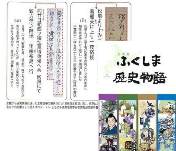
ふくしま歴史物語完成