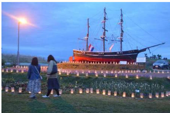
木古内チューリップフェア どうなん追分シーニックdeナイト