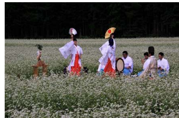
地域の魅力の見せ方（予定項目）