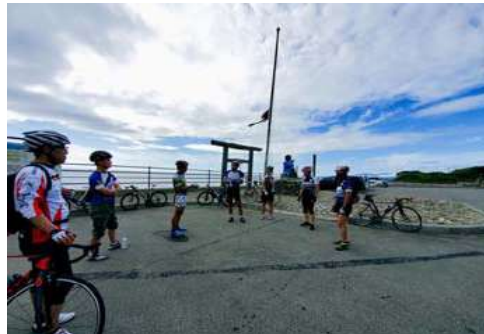
ガイド養成講座開催