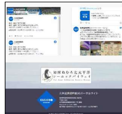
バナー掲載例 (釧路町)