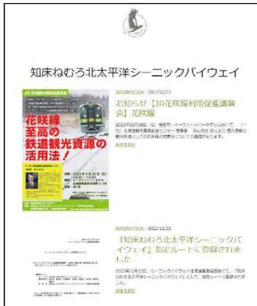
HPによるイベント等の情報発信