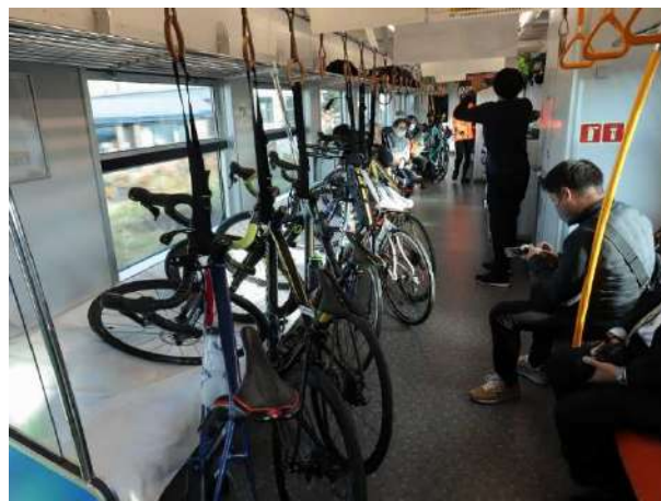
サイクルトレイン車内の様子