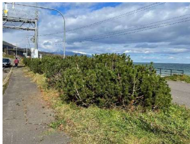
剪定作業後の植栽の状況