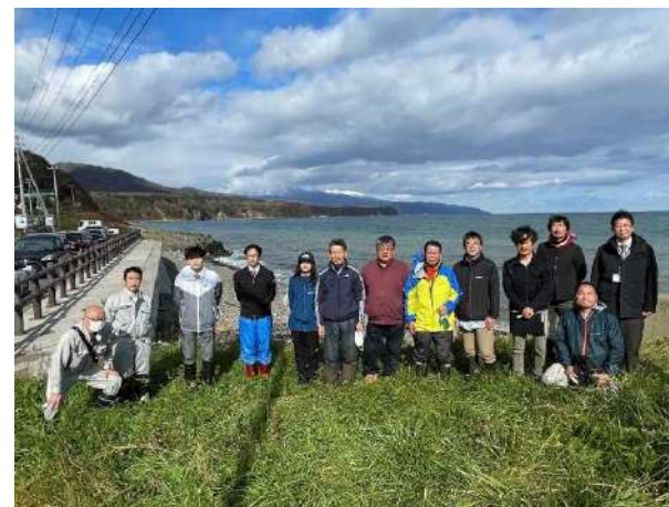
集合写真（知床連山、根室海峡）