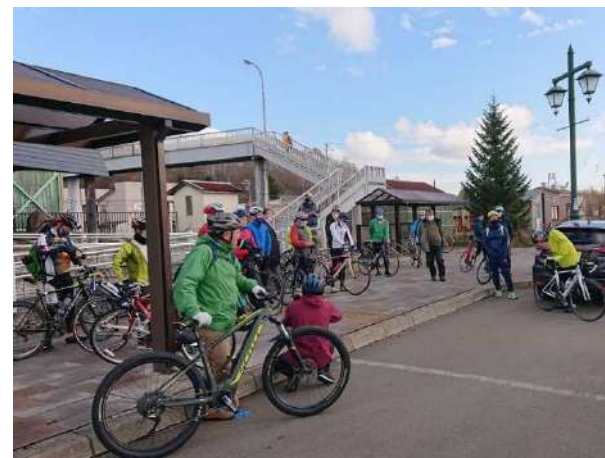
摩周駅（サイクリング開始場所）