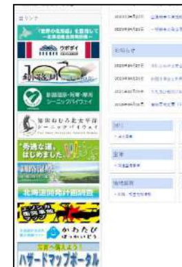
バナー掲載例 (釧路開発建設部)