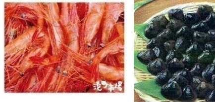
第1弾・萌える天北オロロンルート 増毛産「甘海老」、天塩産「しじみ」