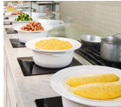
朝食での地域メニュー展開