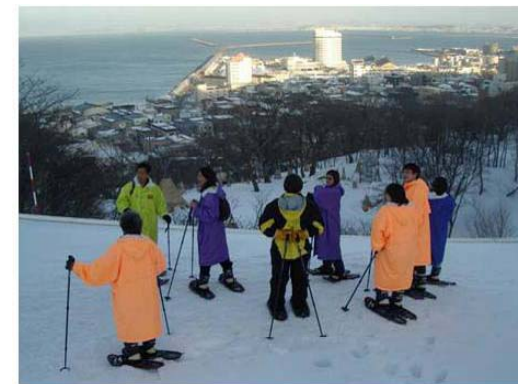
稚内公園：スノーシュー体験