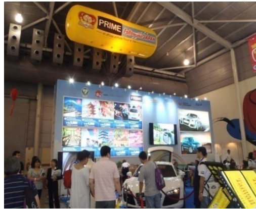
ブースには、ロゴマークを掲示