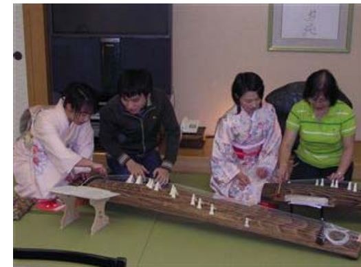
留萌：お琴体験(宿光風館)