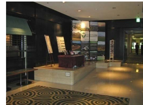
ホテル内「アートステージ」