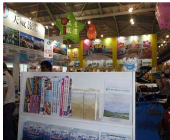
シーニックバイウェイ北海道(英語)パンフを配布