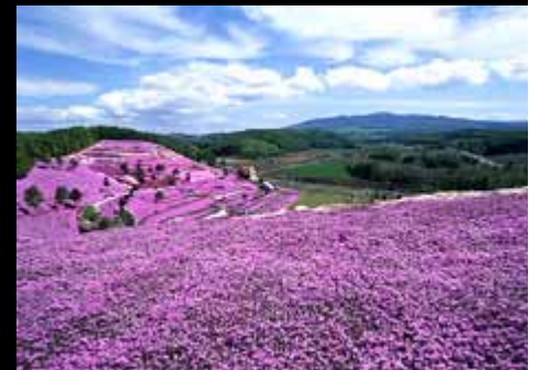
芝桜公園【東藻琴村】