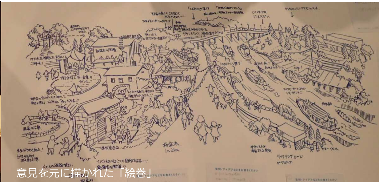
意見を元に描かれた「絵巻」