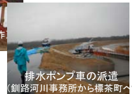
排水ポンプ車の派遣 (釧路河川事務所から標茶町へ)