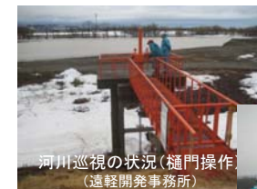
河川巡視の状況(樋門操作) (遠軽開発事務所)