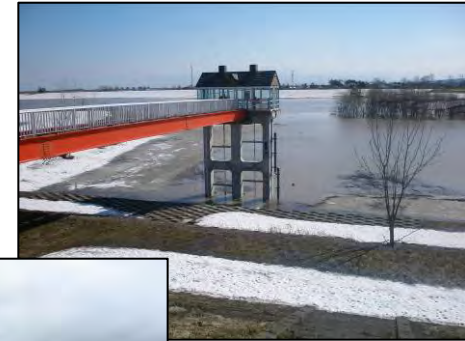
排水機場稼働状況