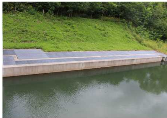
布部川頭首工に設置された魚道