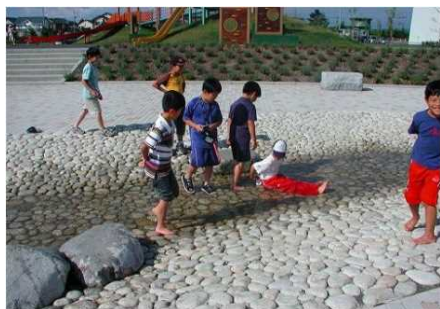
公園内を流れる水路（中富良野町新町公園内） （平成 27 年 8 月 9 日撮影）

本事業及び関連事業では、用水路の一部で、水遊びができる水路や水生生物の観察ができる水路が整備され地域住民に有効に活用されており、生活環境の向上につながっている。