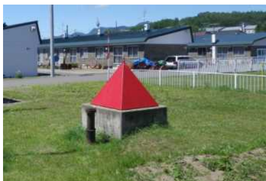
消防水利(防火水槽：補完ハードで整備) 平成 27 年 8 月 9 日撮影

受益農家アンケート調査でも、「用水を活用して防火用水が手当されたことにより、安心感がもてた」と評価されている。