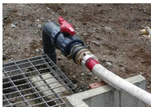
消防用水併用の給水栓 (給水口にアダプターを取付対応) 平成 27 年 8 月 9 日撮影

注：補完ハードとは、生活用水、防火用水、環境用水等の地域用水機能を支える組織とその活動を支援する事業（ソフト事業）を補完する、施設等の整備事業のこと。本地区では、関係市町により整備している。