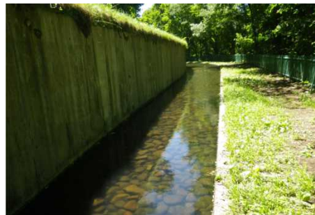
ふれあい水路 （平成 27 年 8 月 9 日撮影）