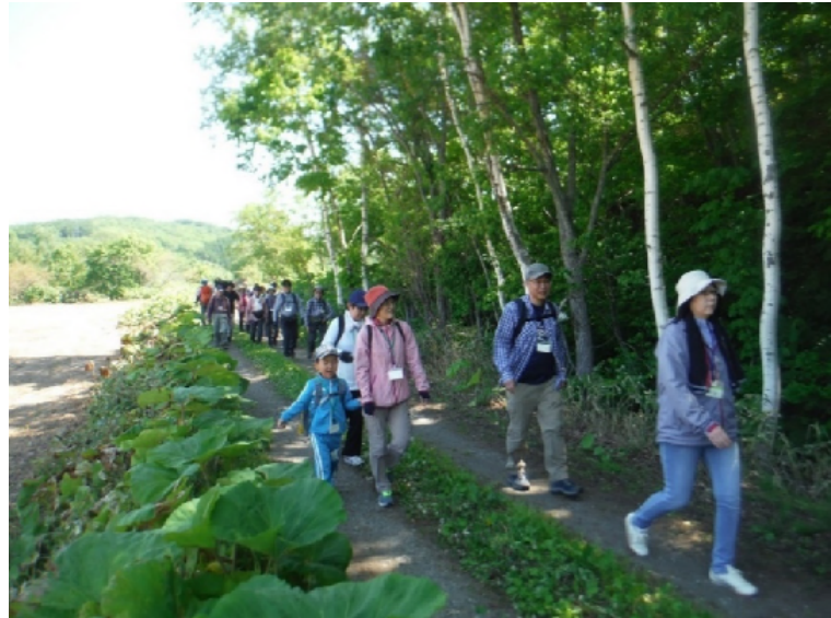
全長10kmに及ぶ「チョコシナイコース」を歩くフットパスイベントの様子