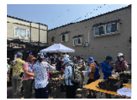
夏のグルメフットパスBBQの様子

「にほんの里100選」に黒松内町が選ばれており町では景観条例を策定、「日本で最も美しい村」連合にも加盟する等、自然と調和した景観を維持する町づくりが行われています。国の天然記念物「歌オブナ林」や日本最古の湿原「歌才湿原」等への自然保護活動も行っています。黒松内の丘陵景観、牧草地、ジャガイモ畑やそば畑等の農業景観、統一された里山環境を体感する上で、歩く速度でゆっくりと観光できるフットパスの活動は、「自然」「農業」「人の営み」を有機的につなぎ、観光地では味わうことのできない黒松内ならではのアピールできる活動となっております。