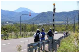
チェックポイント巡り

赤井川観光協会は、イベント内容の充実を進め、SNSの積極的な活用を通じた情報発信に重点を置くことで、観光客の増加を目指しています。