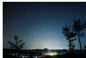
令和元年開催のフォトコンテスト 最優秀賞 カルデラを照らす星々

赤井川観光協会では、農村景観維持のため、草刈りやゴミ拾いなどの活動を行い、自然豊かな村の魅力を体感していただくため、フォトコンテストやほたる鑑賞会など各種イベントを実施し、地域一体で観光地域づくりを行っています。