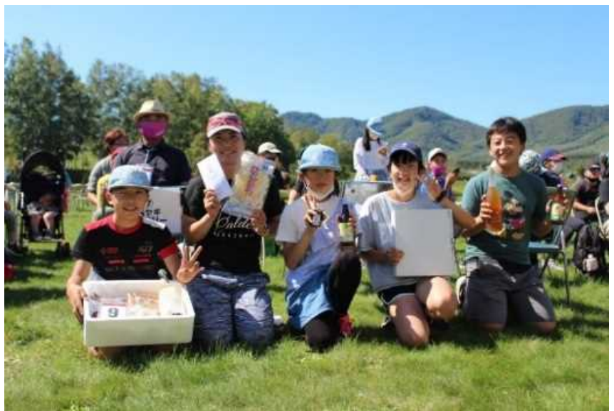
幅広い年齢層の方々が、赤井川村のチェックポイントをメグリました