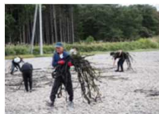
漁業体験（体験ツアー）

広尾町には、日高山脈が織りなす景観や多様な一次産業といった地域資源が存在しています。広尾町の魅力を多くの人に伝えるために、これからも活動を展開していきます。協議会の活動がきっかけで広尾町への移住にまで繋がれば嬉しいです。