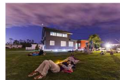
星空鑑賞（体験ツアー）