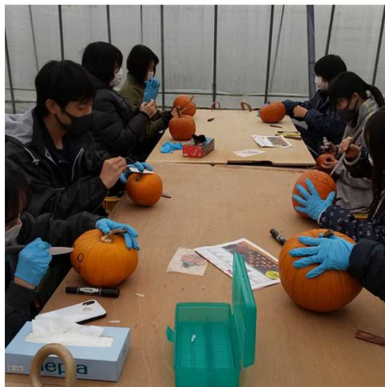
コロナ禍期間中の受入風景（ハロウィン用のランタン作り）