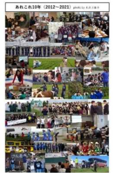
20周年記念誌 からの抜粋

一生の思い出を作れるようにと受入活動を行ってきた結果、20年以上の活動期間で1万7千人以上の方々に農業体験をしていただいていたいて、最近では海外から来る方にも体験をしていただいています。