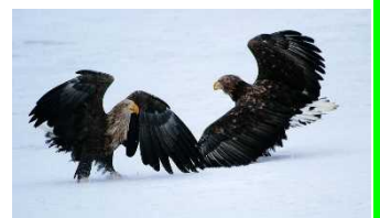
クルーズ船よりバードウォッチング