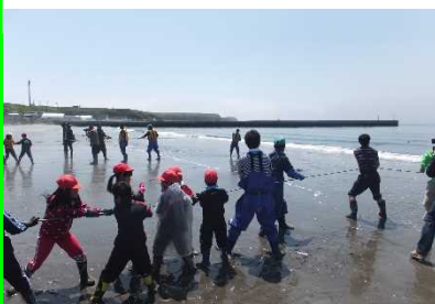
地引網体験の様子

歯舞水産物のブランド化を中心に位置付け、その取り組みを通じた漁業振興、また、歯舞地区の紹介パンフレットを作成して、誘致活動から漁民泊や漁業体験、クルージング等を通じた交流人口の増加による地域の活性化に向けて関係者が一丸となって継続的に取り組み、活気のある漁村づくりを推進しています。