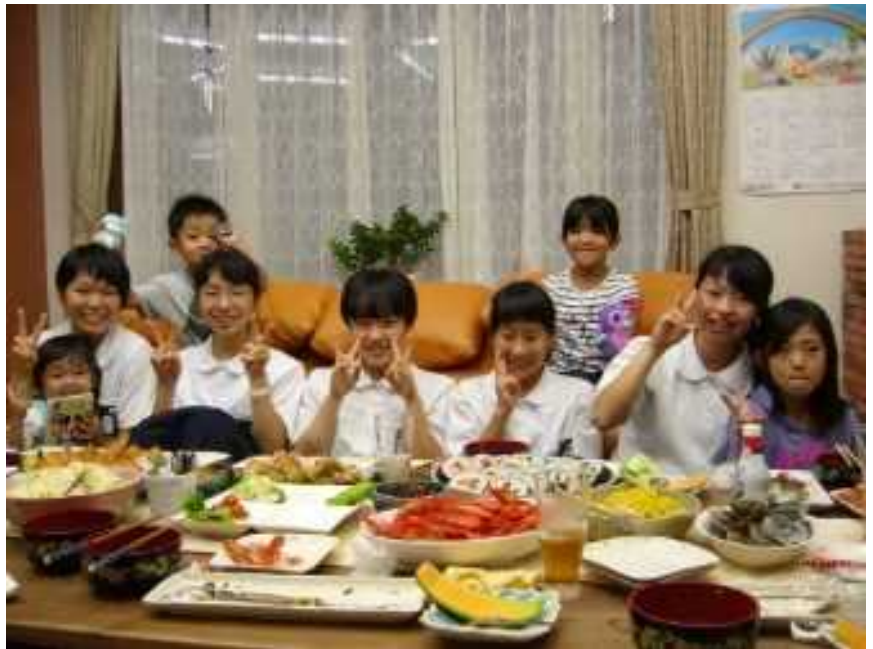
漁民泊体験でおいしい料理を前に!!