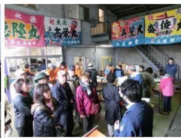
市場の競り見学の様子