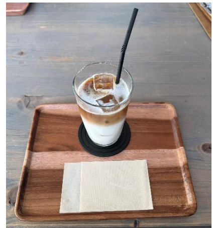
ハニーカフェラテ（アイス）

オホーツク管内の様々な食材を使い、マスターがいる日は機械ではなく、コーヒー豆を選びハンドドリップにて入れてもらえる、こだわりがたくさん詰まったカフェとなっています。皆さんもこちらへお越しの際は、ぜひ味わってみてはいかがでしょうか！