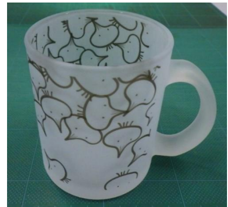
オリジナルマグカップ（筆者が購入）