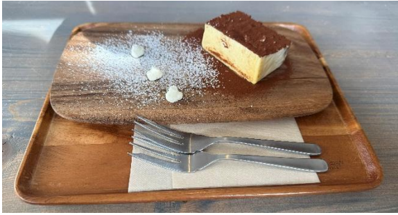
本日のチーズケーキ（ティラミス風チーズケーキ）

ので、マスカルポーネチーズの味もフレッシュなのに強いコクが感じられ、ここでしか味わえないものとなっています。