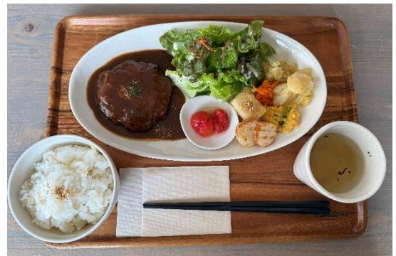
ランチプレート（ハンバーグ（デミソース））

今回、筆者はランチメニューとして食べることができる「ランチプレート（副菜・ライス・スープ付）」の中の「ハンバーグ（デミソース）」を選んで食べてきました。自家栽培の野菜を数多く使った「副菜」