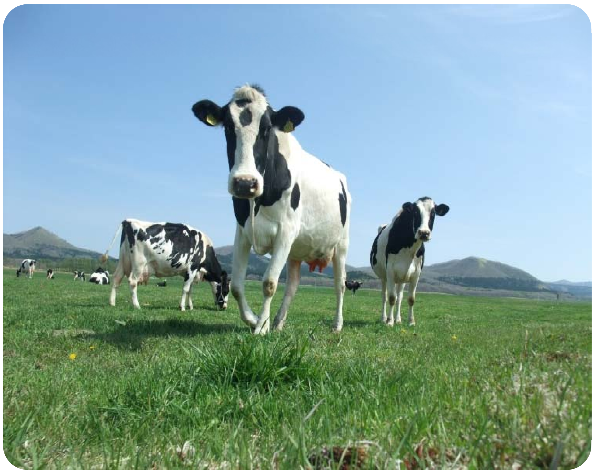
摩周大草原での放牧風景