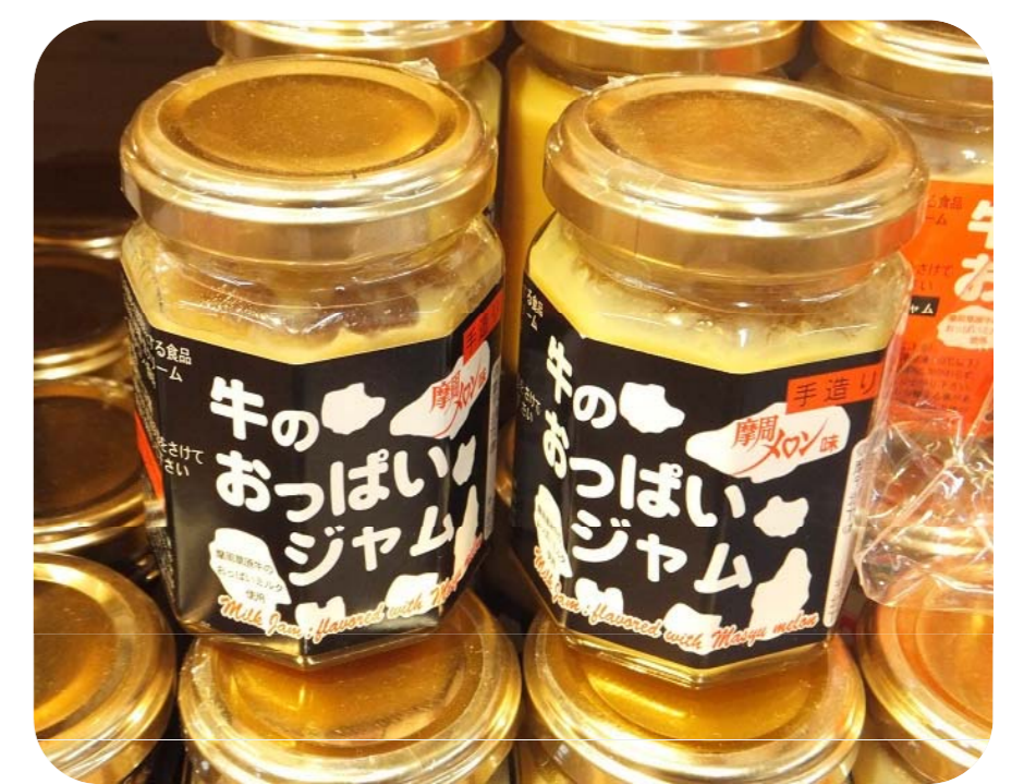
自家生産の生乳を用いた商品