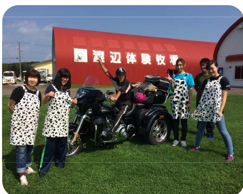
旅行者との記念撮影(右)