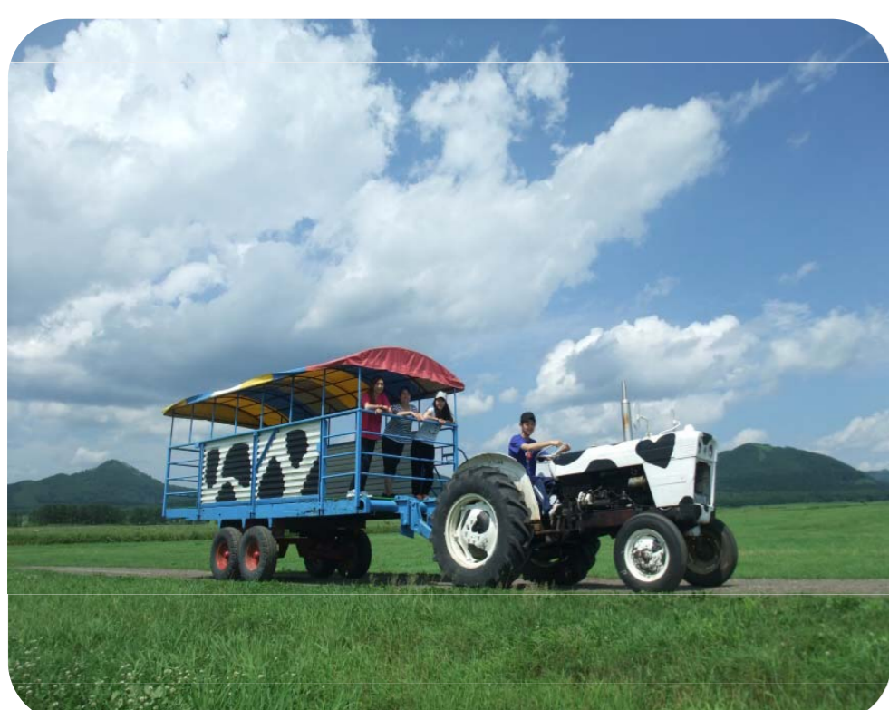
トラクターで草原を周遊(左)

来場者とのコミュニケーションの中から得たヒントを元に作られた体験メニューは、乳搾り体験、乳製品作り体験、牧草地の散策、芝刈り機体験や牧場クイズなどと多岐にわたり、年間約3万人の利用者が訪れ、延べ46万人に及びます。また海外の利用者も増えています。