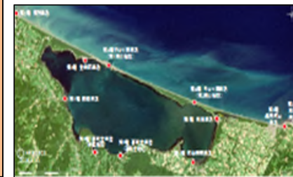
【サロマ湖地域9漁港】

サロマ湖漁港(第4種) 常呂漁港(第2種) 湧別漁港(第2種) 常呂河口漁港(第1種) 栄浦漁港(第1種) 浜佐呂間漁港(第1種) 富富士漁港(第1種) 芭露漁港(第1種) 登栄床漁港(第1種)